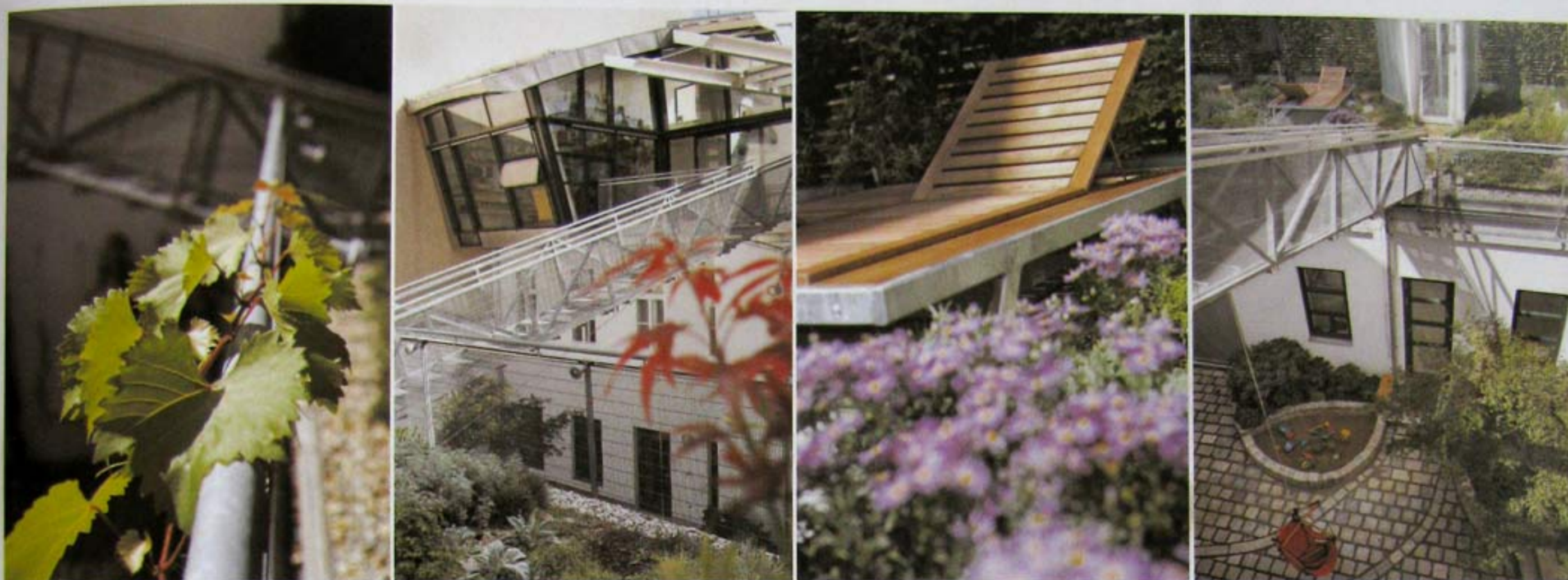
Ungewöhnliche Perspektiven, schräge Winkel und Verbindungswege sind die Hauptmerkmale dieses urbanen Freiraums.

Das Erste, was ins Auge sticht, ist das Haus. Genauer gesagt der moderne „Kopf“, den das Gründerzeithaus aufgesetzt bekommen hat. Ein Glaskörper, schräge Winkel, ungewöhnliche Perspektiven und viel Transparenz. Als Nächstes macht sich die Brücke bemerkbar, ein schmaler Steg aus Stahl, der den Innenhof überspannt und das Haus der Architektenfamilie Liaunig mit dem Dachgarten verbindet. Und da ist man auch schon bei der Besonderheit der Architektur angelangt: einem Garten, der sich auf mehreren Ebenen erstreckt, durch Wege miteinander verbunden und von allen Seiten erlebbar ist.